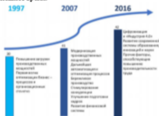
Рис. 1. Цифровая трансформация экономики

Цифровая экономика в настоящее время является основой экономического развития страны. Ниже представлено (рис. 1) развитие цифровой трансформации экономики в России, с 1997 по настоящее время.